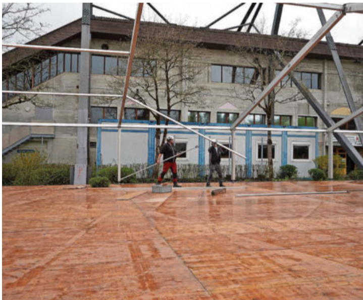
Das Zelt vor der Eishalle ist schon fast aufgerichtet.