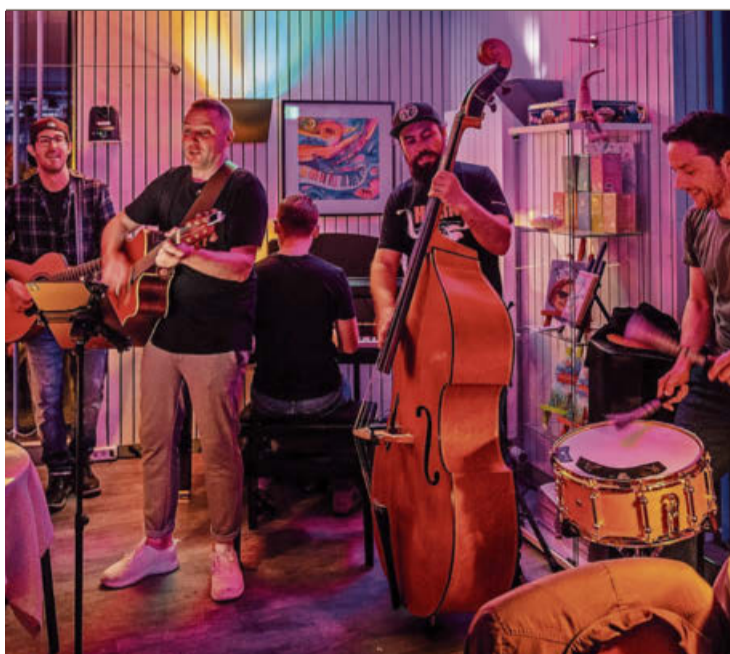
Die Zugaben wurden unplugged, ganz zur Freude des Publikums, gespielt.