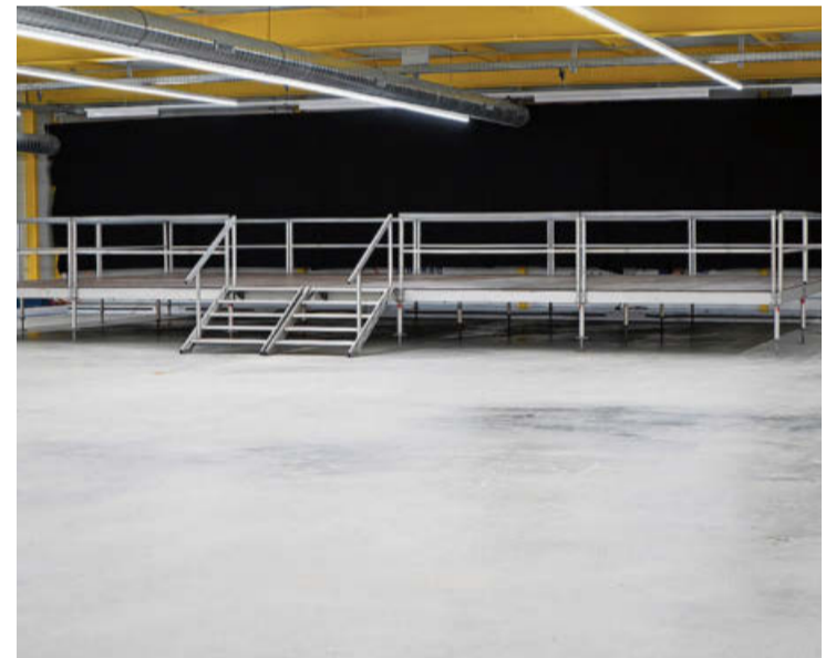
Bald werden vor der Bühne Holzbänke und eine Bar aufgestellt.