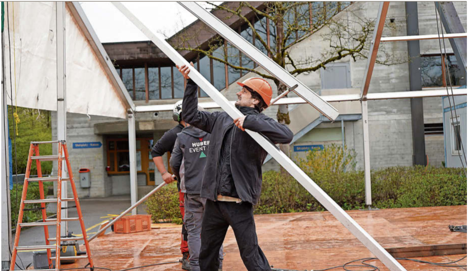
Bei der Kunsteisbahn Im Chreis in Dübendorf laufen die Vorbereitungen für die Dübi-Mäss auf Hochtouren.