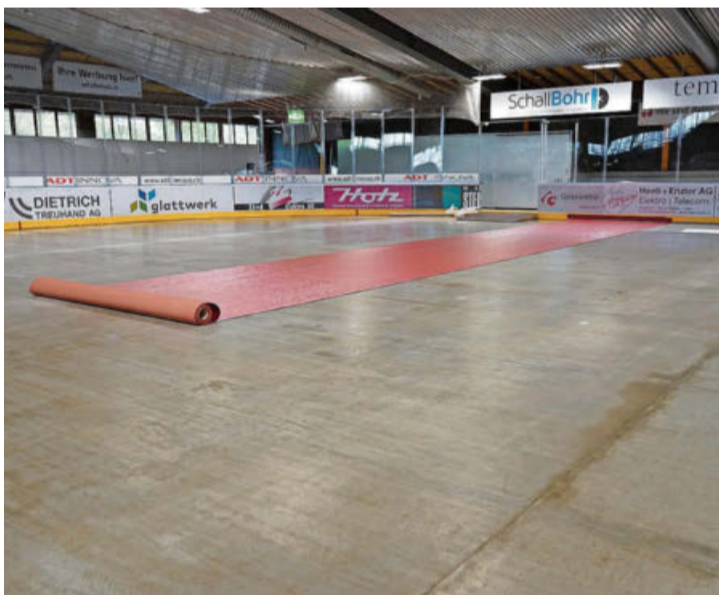
Damit die Besucher nicht vom Weg abkommen, werden sie mit einem roten Teppich durch die Halle geleitet.